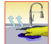
Opnemen en laten drogen

Aanbevolen gereedschap: Emmer, borstel, dweil, spons.