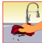
Grove verontreini- gingen verwijderen

HMK P303 keramiek reinigings-spray Verbruik: ca. 40-60 m 2 /liter (geschikt voor binnen en buiten)