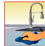
Kort met droge doek nawrijven