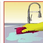
Vuil water opnemen