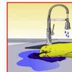
Met helder water naspoelen