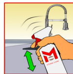
Voor gebruik goed schudden